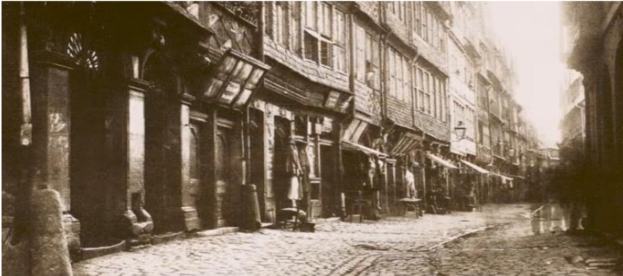
De ommuurde Judengasse aan de voet van de middeleeuwse stadsmuur van Frankfurt in de 17 e eeuw

Frankfurt heeft een lange Joodse traditie. In de 15 eeuw werd aan de voet van de middeleeuwse stadsmuur de Judengasse als eerste getto in Europa ingericht. Met de emancipatie in de 19 e eeuw ontvluchtten de Frankfurter Joden het benauwende overbevolkte getto met uitzondering van Gutle Rothschild, de stammoeder van het illustere bankiersgeslacht. Zij bleef er wonen tot aan haar dood in het midden de 19 e eeuw. Daar herinnerde zij haar