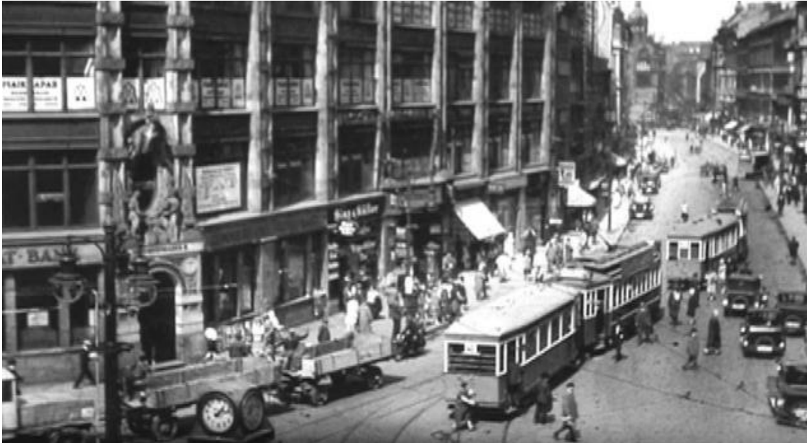
De Rosenthaler Straße vóór de oorlog, toen nog een levendige straat midden in de Joodse buurt van Berlijn.

De bombardementen op de stad heeft deze wijk relatief goed overleefd. In de DDR-jaren is de bouws substantie wel volledig verpauperd. De stuc was grijs en viel van de gevels. Het houtwerk zag er haveloos uit. Op de stoep lagen overal hopen briketten die van staatswege verstrekt werden. Het stonk er indringend naar bruinkoolverbranding en tweetactmotoren. De huurkazernes hadden geen fatsoenlijke sanitaire voorzieningen. Meerdere gezinnen moesten samen 1 toilet delen.