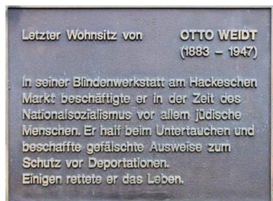
Gevelplaat bij de laatste woning van Weidt in Berlin-Zehlendorf