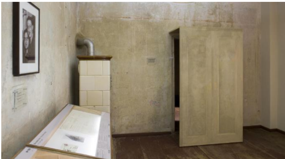
Reconstructie van een schuilplaats achter een kast in de blindenwerkplaats van Otto Weidt

Pas in 1998 werd de locatie, waar zich vanaf 1936 de bezemfabriek van Otto Weidt bevond, herontdekt. In 1999 werden de ruimtes ingericht als gedenkplaats voor stille helden die in Berlijn Joden onderdak boden, waardoor 1400 Joden konden overleven, onder hen ook Inge Deutschkron. Otto Weidt staat in het