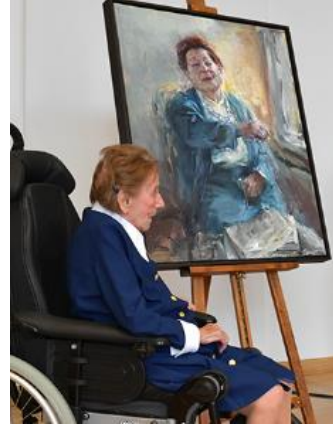
Inge Deutschkron. 2018

Het is aan de holocaustoverlevende Inge Deutschkron te danken, dat Otto Weidt niet vergeten is. Ze is inmiddels 99 jaar oud.